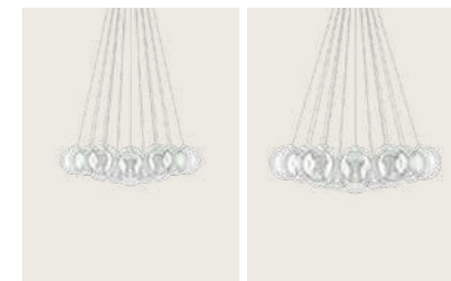
Random Cloud 23 Lights Ø23 Random Cloud 23 Lights Ø28 » Suspension lamp NEW LAMP